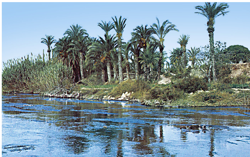
La proximitat del palmerar confereix un exotisme sorprenent al Baix Vinalopó, a Daimés. Les palmeres, tanmateix, més que islàmiques són romanes.

l'esquifit cabal, ha estat minuciosament aprofitada per farineres, martinets d'esparg i molins paperers des de Banyeres de Mariola en avall, sobretot a Elda i a Elx.