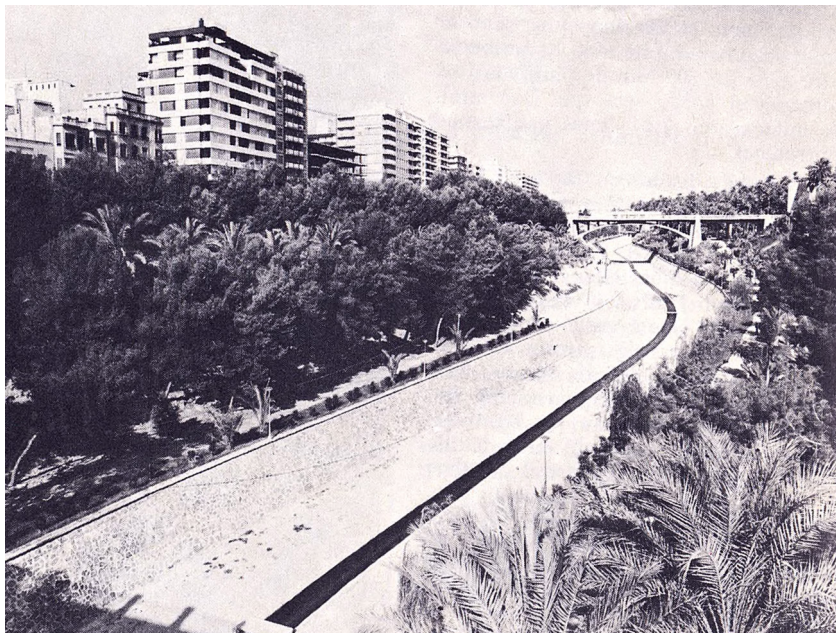
El Vinalopó quan passa per Elx, disciplinat i protegit pel ciment. El pont, novíssim, arrenca del palau de la Senyoria, a la ribera esquerra.