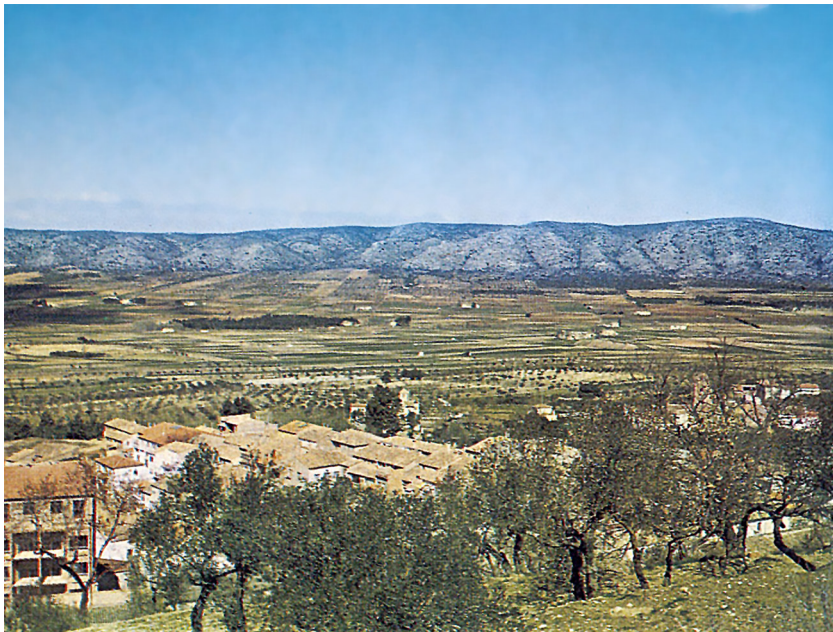
La plana vall del Vinalopó alt, vista des de Banyeres de Mariola

el 1858 s'estenia la línia ferroviària d'Alacant a la corte ; això implicaria el control i el drenatge del tràfic comarcal i supracomarcal vers el port d'Alacant, ja prefigurant per la tragneria que és a la base de l'inici de les activitats artesanies-industrials. Aquesta terra, buida de cristians fins al final de l'Edat Mitjana, faria el paper de marca molt de temps i els castells hi tenien la seua part. Per parlar només dels que fiten el riu, el Castell d'Elda —enfrontat al de Petrer— dominava la vila i el pas del riu, allà encaixat. El de Novelda, amb la torre triangular subaix de la Mola, s'apropa al riu per a materialitzar més palesament el paper de guàrdia del pas fluvial.