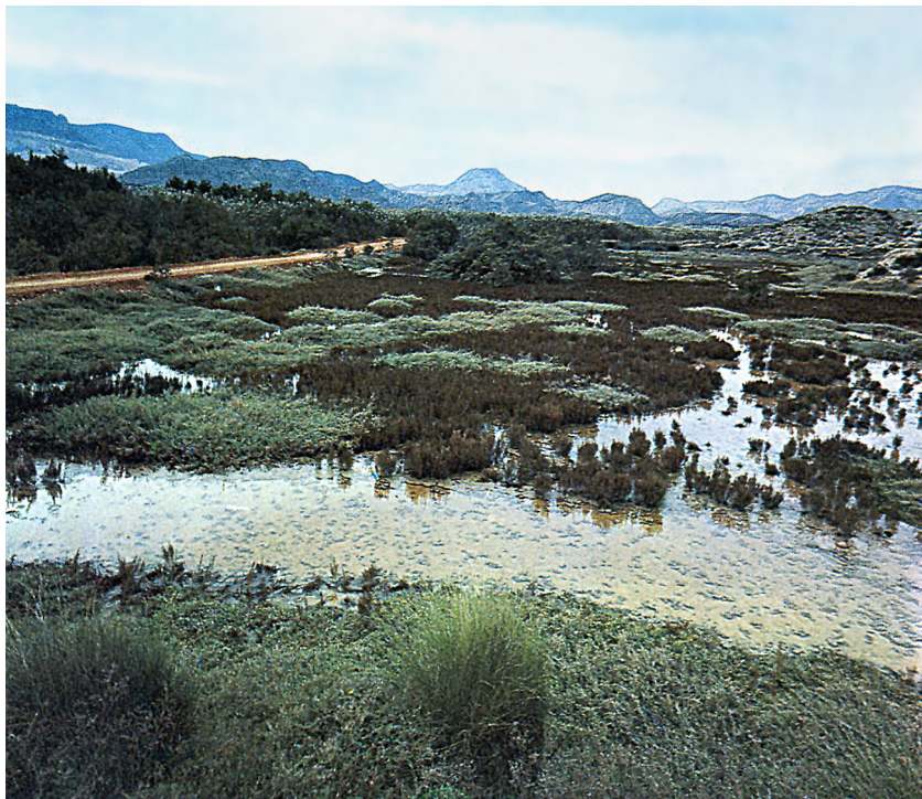
El riu és, en realitat, aigües amunt de la presa d'Elx, una cinta d'aiguamolls. Una carretera, feta de deixalles de bòvila, permet de passar-hi entre carrissars i boga