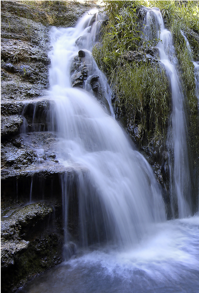
Toll Blau al curs alt del riu Vinalopó.