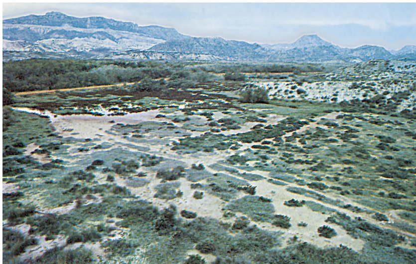
El Vinalopó, camps abandonats, cases i una gran aridesa.

La rambla del Vinalopó, en travessar perpendicularment el muntanyam prebètic i subbètic valencià, ve a soldar tres rius que abans —geològicament parlant— serien independents o, almenys, discontinus. Per això hi trobem tres segments no gaire homogenis: l'alt, fins prop de Villena, un segon tram fins al nord d'Elda, i el sector terminal —el vertader paleo-Vinalopó— que hom encara podria subdividir amb l'alineació de Tabaià.