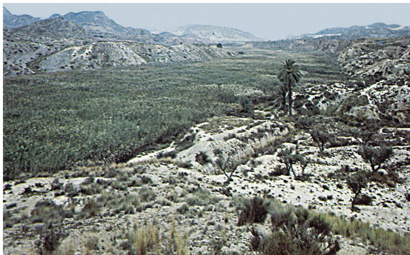
Una terra alta, quasi desèrtica, en contrast amb la cua de l'embassament.

l'esquifit cabal, ha estat minuciosament aprofitada per farineres, martinets d'esparg i molins paperers des de Banyeres de Mariola en avall, sobretot a Elda i a Elx.