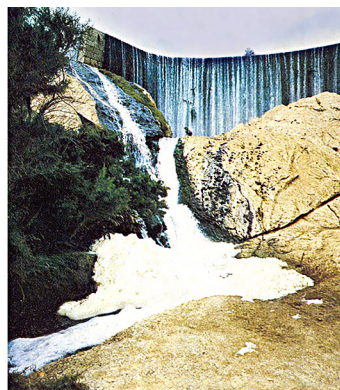
La resclosa d'Elx, construïda el 1650 i restaurada el 1786 i el 1842, és menys útil que impressionant. La figura humana a cim del mur ens en fixa les proporcions. L'escuma blanca amuntegada a primer pla ens parla dels detergents que baixen amb l'aigua.

una allau immigratòria que ha buidat els camps i les comarques veïnes i, de vegades, les llunyanes. Avui en dia, els ciutadans d'Elda ja no sabrien qui era Castelar, on el tenien gairebé per fill; les barraques de la vorera del Vinalopó a l'oest de la ciutat estatgen manes onades de nou arribats.