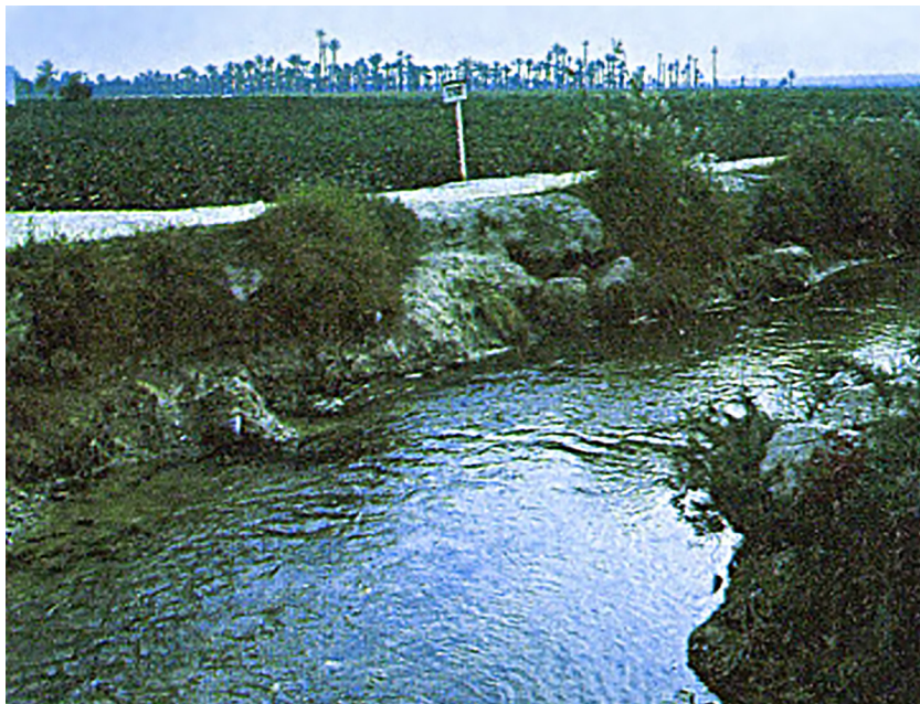
Cap a la desembocadura, abans dels Saladars, poc més que una claveguera entre camps de cotó i datilers.

tragerineria— pogué constituir el capital de qualque fàbrica. Ara, tret dels ametlers, les parres de raïm de balança i algunes vinyes per a vi, l'agricultura va de rota batuda.