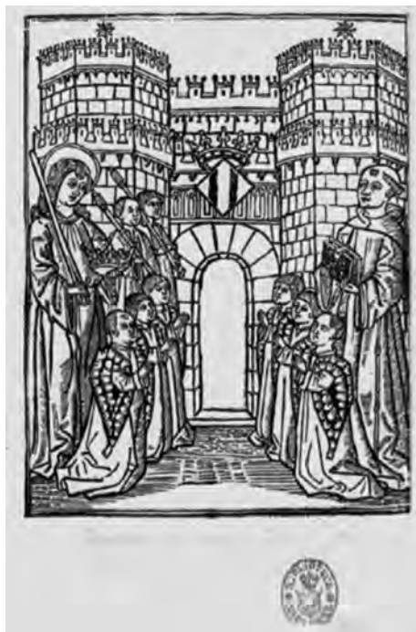
Imagen 2. Arriba. Contraportada del Regiment de la cosa pública . Abajo. Imagen de Probadas flores romanas .